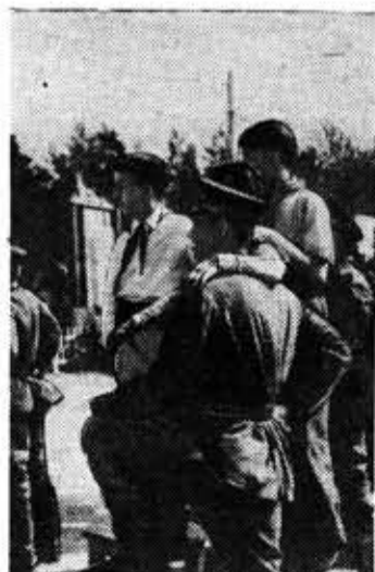
Советские воины в гостях у пионеров. Идет концерт.

Впрочем, предоставим слово самим ребятам. Они лучше расскажут о своем отдыхе в лагере.