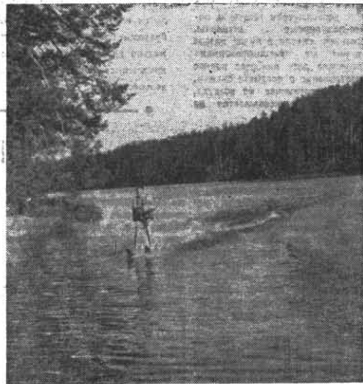
Воднолыжный спорт за последние годы получил права гражданства и в нашем институте.

Пусть же усилия общественных организаций, каждого комсомольца будут направлены к тому, чтобы красивее, духовно богаче становилась наша жизнь!