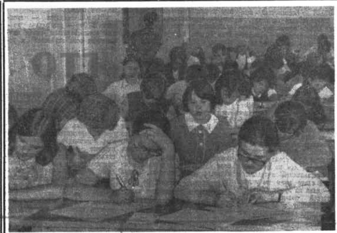
Вчерашние абитуриенты — сегодняшние первокурсники.