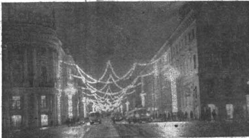
ГОРОД В ПРЕПРАЗДНИЧНОМ УБРАНСТВЕ.

СОВЕТСКИЕ УЧЕНЫЕ, КОНСТРУКТОРЫ, ИНЖЕНЕРЫ, ТЕХНИКИ, ИЗОБРЕТАТЕЛИ И РАЦИОНАЛИЗАТОРЫ! ВСЕМЕРНО УСКОРЯЙТЕ НАУЧНО-ТЕХНИЧЕСКИЙ ПРОГРЕСС, УКРЕПЛЯЙТЕ СВЯЗЬ НАУКИ С ПРОИЗВОДСТВОМ! ДОБИВАЙТЕСЬ БЫСТРЕЙШЕГО ВНЕДРЕНИЯ В НАРОДНОЕ ХОЗЯЙСТВО ДОСТИЖЕНИЙ СОВРЕМЕННОЙ НАУКИ И ТЕХНИКИ!