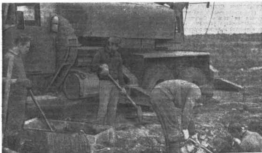
Из фотолетописи ССО-72. Набережные Челны. Бригада литмонавтов подготавливает фундамент на строительстве клуба.