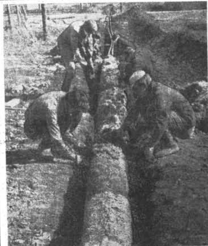
Из фотолетописи ССО-72. На строительстве Камского автомобильного завода. Бойцы отряда «Понск» прокладывают теплоотрасту.

В отношении размеров: многие студенты стремятся лишь проставить размеры, не задумываясь о месте их по проекциям. Если бы такие чертежи дошли до производства, то читающий чертеж должен был бы затратить много лишнего времени на поиски нужных размеров. Однако в стандарте ЕСКД, устанавливающим основные правила нанесения размеров, говорится, что размеры, относящиеся к какому-то одному элементу, следует помещать по возможности в одном месте и там, где этот элемент наиболее полно