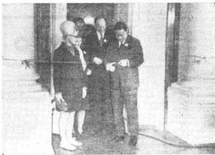
На выставке «Студенты Ленинграда — 50-летию СССР». На снимках: момент открытия. У стендов ЛИТМО.