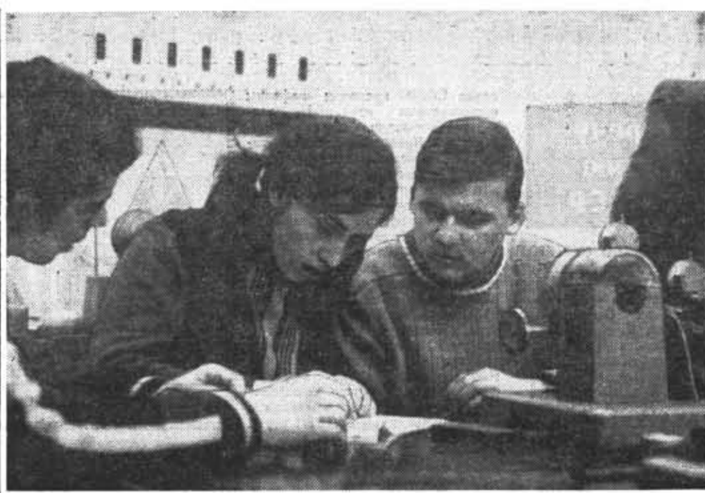
СТУДЕНТЫ-ТРЕТЬКУРСНИКИ ВЫПОЛНЯЮТ ЛАБОРАТОРНУЮ РАБОТУ НА КАФЕДРЕ ТЕОРИИ МЕХАНИЗМОВ И ДЕТАЛЕЙ ПРИBORОВ

Практика показывает, что специальные знания стареют гораздо быстрее фундаментальных. Инженер, обладающий глубокими и прочными знаниями в области математики, физики и других основополагающих дисциплин, легко воспринимает и усваивает новейшие сведения из сферы