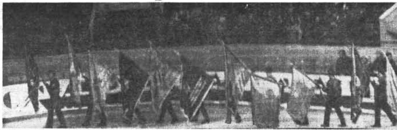
ПАРАД ЗНАМНОСЦЕВ НА ГОРОДСКОМ СЛЕТЕ СТУДЕНЧЕСКИХ СТРОИТЕЛЬНЫХ ОТЯДОВ.

В СООТВЕТСТВИИ с решением XXIV съезда КПСС в парторганизации ФОМП начата подготовительная работа и предстоящему обмену партийных документов. С целью поднятия активности отдельных коммунистов в общественной и учебно-производственной работе с ними проводятся товарищеские собеседования.