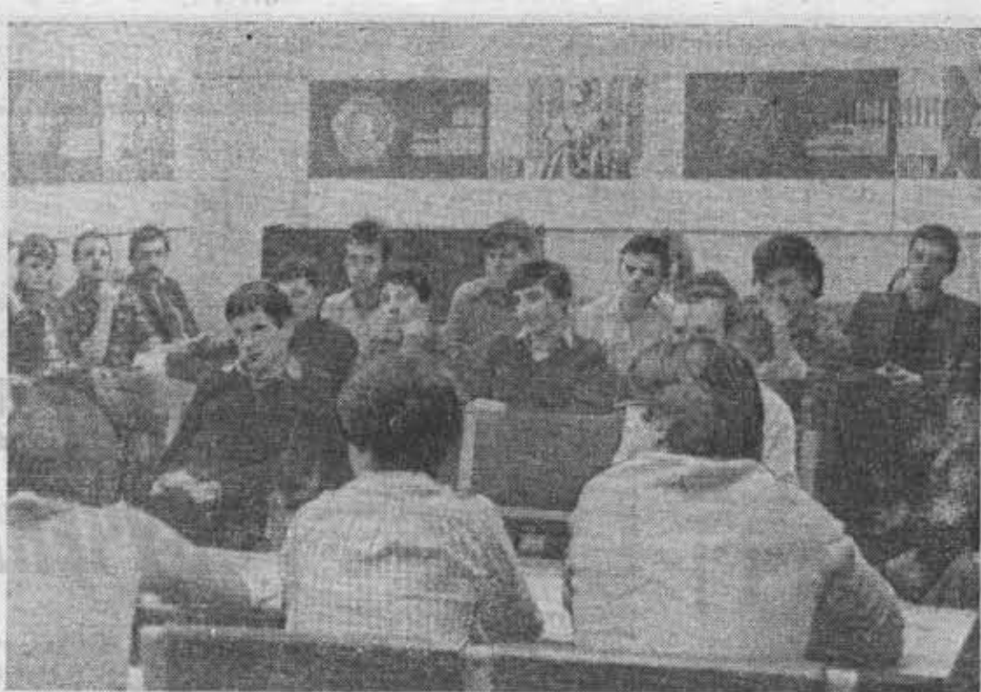
На отчетно-выборном собрании институтской ячейки Социалистического союза польских студентов.