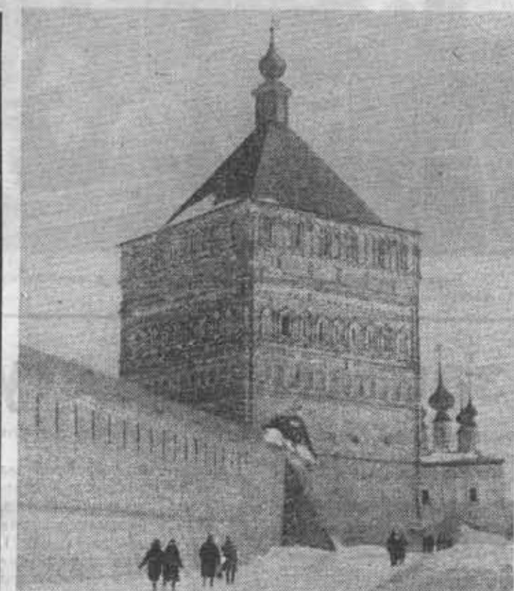
Зима — пора туристских экскурсий по «Золотому кольцу». Многие наши студенты и сотрудники отправятся по профсоюзным путевкам в древний Суздаль. На снимке: одна из достопримечательностей города Спасо-Евфимиевский монастырь.