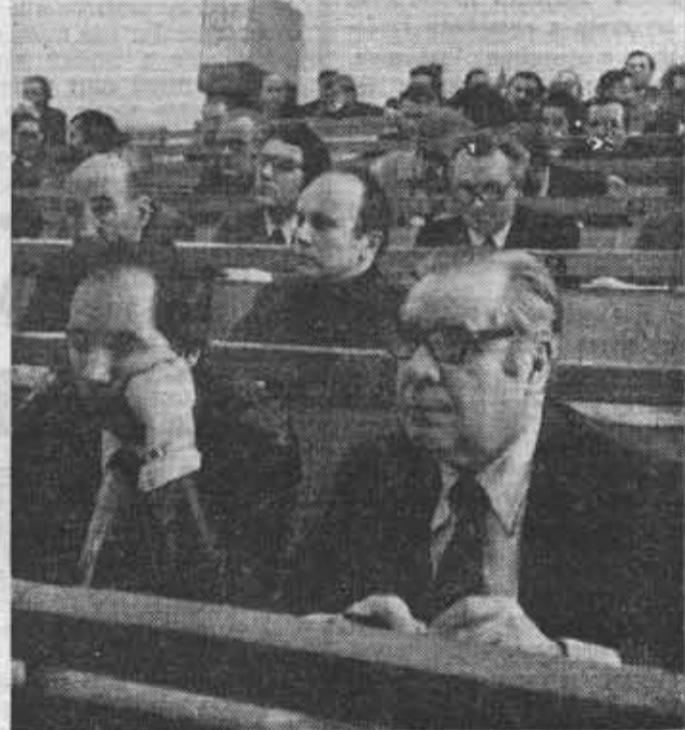
На собрании партийно-хозяйственного актива института, посвященном принятию социалистических обязательств на 1981 год.