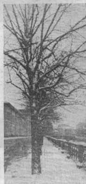
Весной на Мойке.