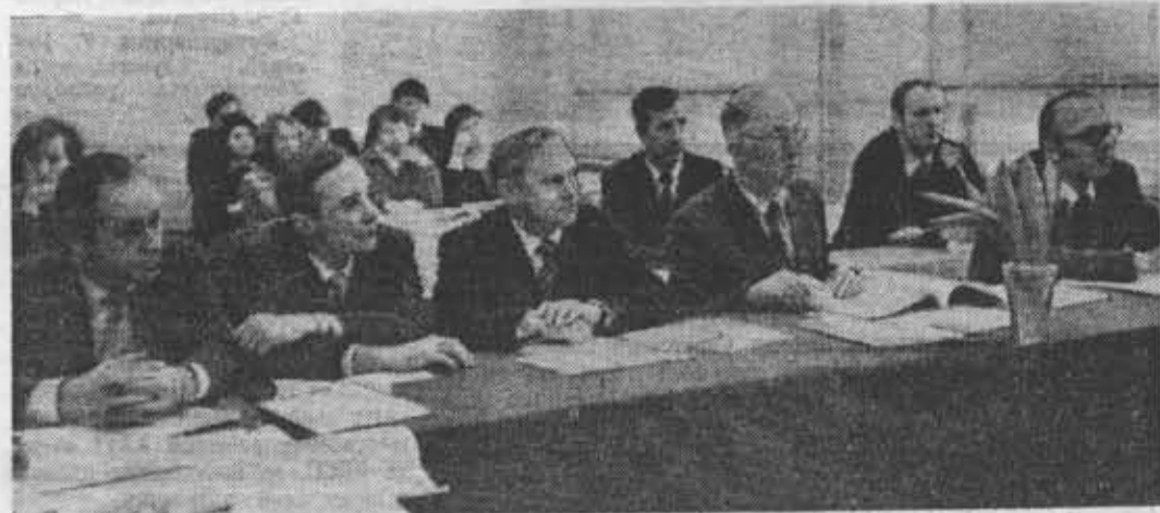
Заседание Государственной экзаменационной комиссии по специальности «Конструирование и производство электронно-вычислительной аппаратуры». Студент 626-й