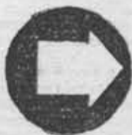
Из фотолетописи ССО.

дах они проходят на самых разных уровнях: от состязаний между бригадами до встреч между лучшими отрядами различных РССО. Кстати, в отряде «Гатчинский», куда поедет большинство первокурсников, уровень проведения спортивных мероприятий