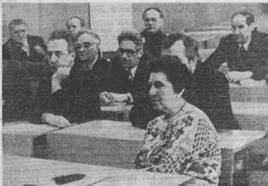
Итоги зимней экзаменационной сессии были обсуждены на заседании совета факультета точной механики и вычислительной техники. С до-