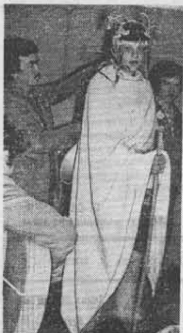
Из фотолетописи ССО. В отряде «Юстус» был проведен конкурс на лучший костюм XXI века.