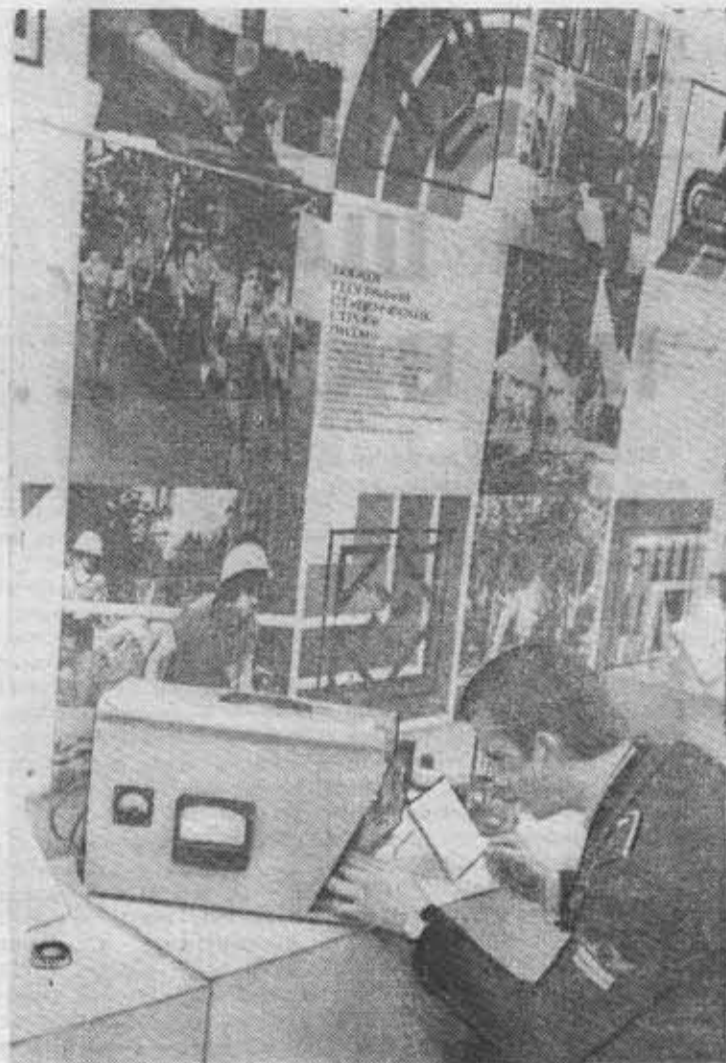
У стенда ЛИТМО на городской выставке научно-технического творчества студентов в Гавани.