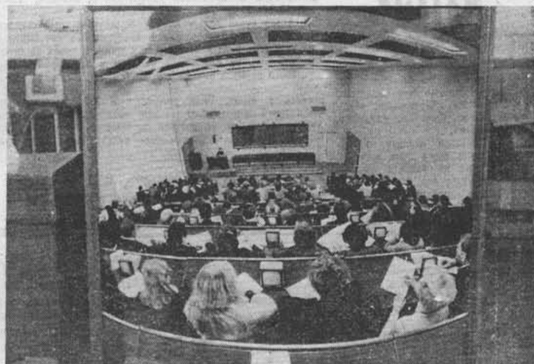
Внедрение технических средств обучения в вузах страны. На снимке: аудитория Челябинского политехнического института, оборудованная телевизионным контролирующим классом «Фотон».

С этого года права отдельного формирования получила дружина