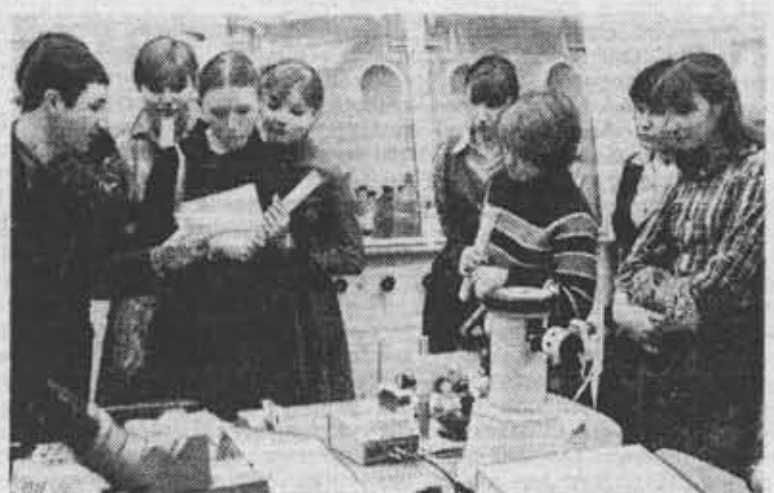
Для ознакомления будущих абитуриентов с профилем нашего института проводятся «Дни открытых дверей». На снимках: школьники в лабораториях