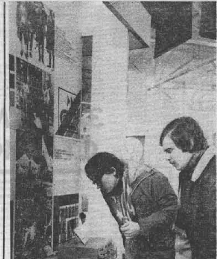
У стендов ЛИТМО на городской выставке студенческого научно-технического творчества в Гавани.

ставляют работу СКБ для учебных лабораторий кафедры физики, их авторы — студенты разных курсов и специальностей, некоторые из них уже окончили вуз, а другие, те, кто работал над ними на первых курсах, — получили возможность видеть свои установки внедренными в учебный процесс.