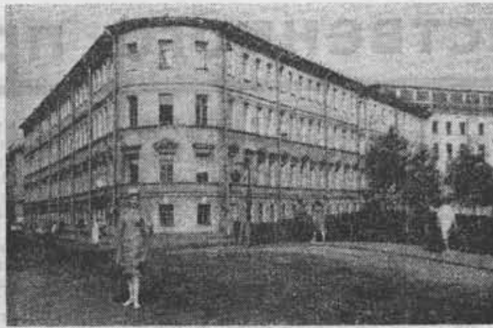
Из фотолетописи ЛИТМО.

Первые послевоенные годы. Возводится новый корпус радиотехнического факультета (сни-мой слеза).