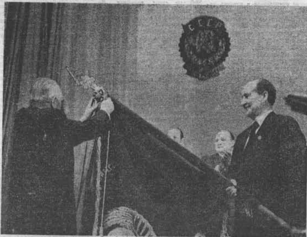
Министр высшего и среднего специального образования СССР В. П. Елютин прикрепляет орден к знамени института.