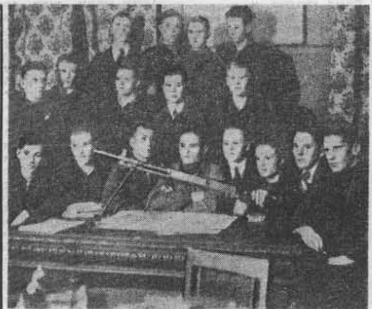
Из фотолетописи ЛИТМО. Занятия в кружке Осоавнахима.

В ответ на заботу родной партии и Советского правительства комсомольцы института стремятся глубоко и творчески овладеть знаниями. 55 процентов студентов учится на «хорошо» и «отлично». За последние два года число групп со 100-процент-