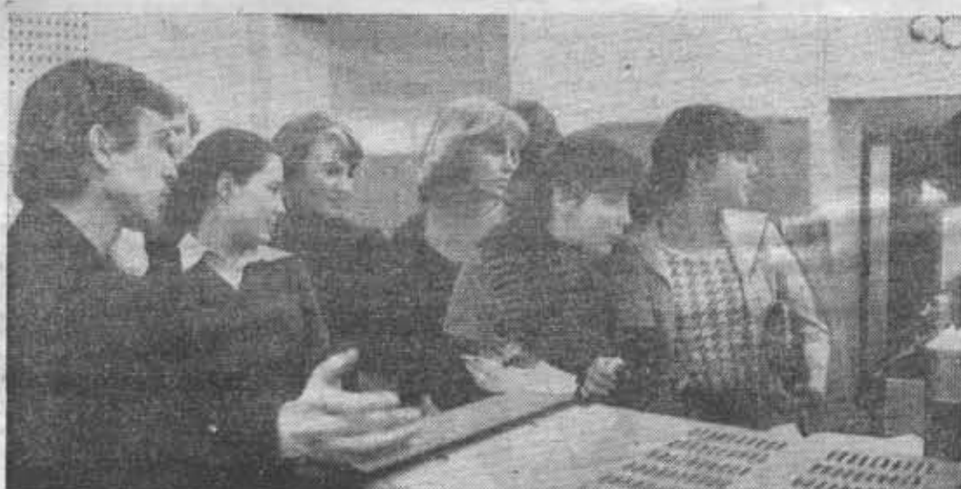
Выбрать профессию по душе вчерашним абитуриентам, а сегодняшним студентам во многом помогали «Дни открытых дверей». На снимке: наши гости в лабораториях ФТМВТ.

Редактор Ю. Л. МИХАЙЛОВ М-12122 Заказ № 7039 Ордена Трудового Красного Знамени типография им. Володарского Ленинград, Ленинград, Фонтанка, 57,