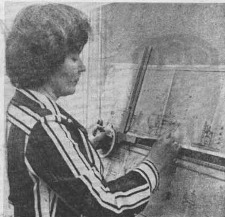
НАША ДОСКА ПОЧЕТА