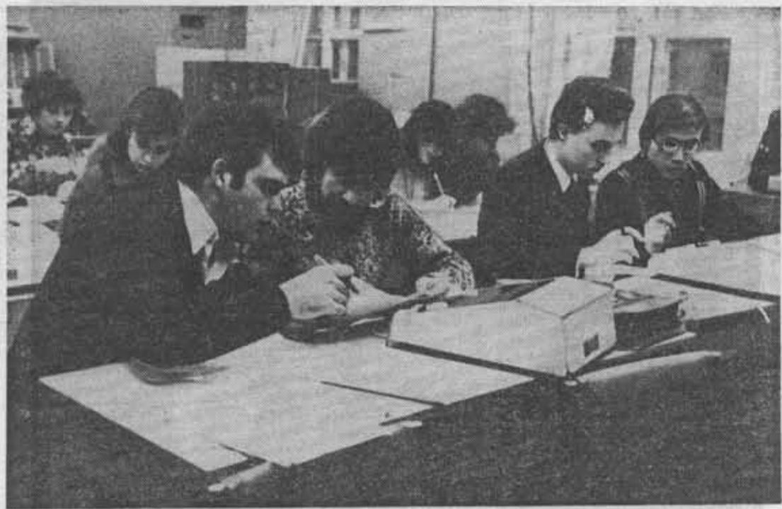
Студенты четвертого курса оптического факультета на занятиях в лаборатории кафедры экономики промышленности и организации производства.

Учитывается при подведении итогов количество дипломных, курсовых и учебно-исследовательских работ, выполненных на уровне изобретения и рационализаторства. Ведется и подсчет сту-