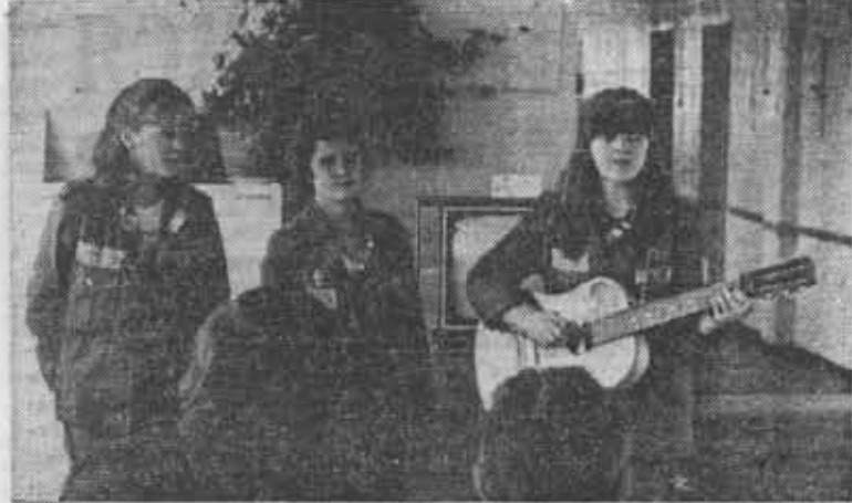
Из фотолетопки ССО-81. На снимке слева: бойцы отряда «Спектр». На правом снимке: выступление агитбригады ССО «Прометей» в Гатчинской районной больнице.