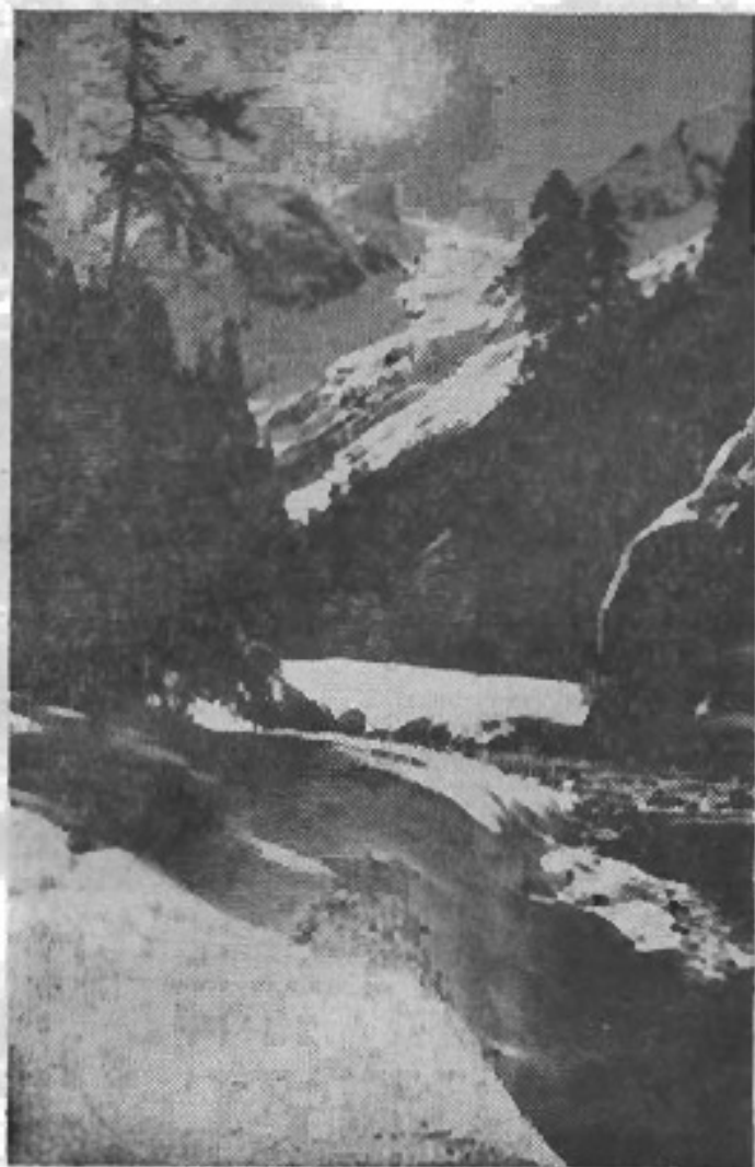
Ущелье Аманауз.

ОСМОТРЕТЬ выставку работ фотолюбителей ЛИТМО очень легко. Встал возле красивого уголка общежития в пяти-шести шагах от ступы, на которой размещены снимки, — и вся выставка перед глазами. Все глядеть семь фотолюбителей. Рассматривая эти фотографии, сразу же чувствуешь, что именно заставило участников выставки взять в руки фотоаппарат, что руководило ими при выборе объектов для съемки.