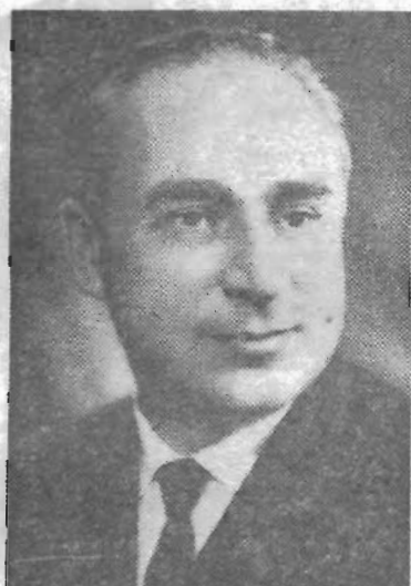
ЗАВАРУХИН Юрий Ильич, секретарь Ленинградского горкома КПСС