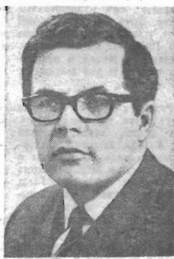
ПЕТРОВ Андрей Павлович, композитор, председатель правления Ленинградского отделения Союза композиторов РСФСР