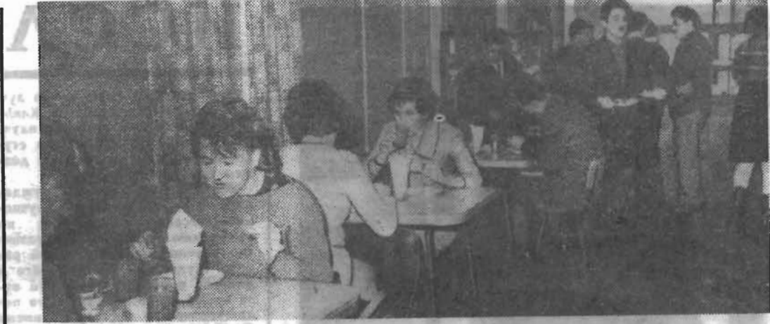
Буфет в общежитии работает с полной нагрузкой, особенно в час «пик». Конечно, хорошо, что здесь, у себя дома, можно перекусить, выпить стакан горячего чая. Но студенты все же мечтают о большем — о стационарной, хорошо оборудованной столовой...

Ничто не может соперничать с телефоном как средством экономии времени, когда надо получить какие-то данные, сделать заказ, выяснить недоразумение,