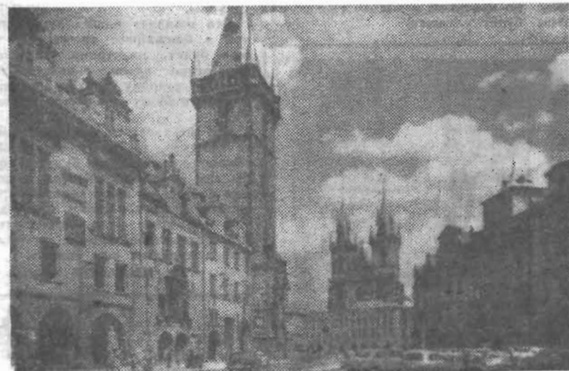
Прага. Староместская ратуша. Тынский храм.