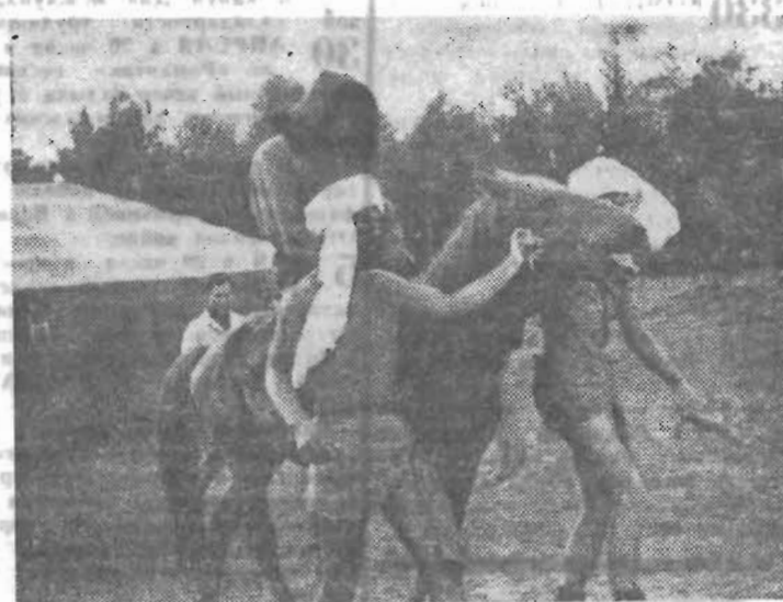
Посвящение в целинники.

В конце июля в отряде состоялось посвящение в целинники. Бывалые строители разработали целый ритуал. У отрядного флага возвели кирпичный монумент в честь строителей. Совершалось «помазание» кумысом: под барабанную дробь выливалась на посвящаемого целая пиала. Каждая бригада давала клятву: