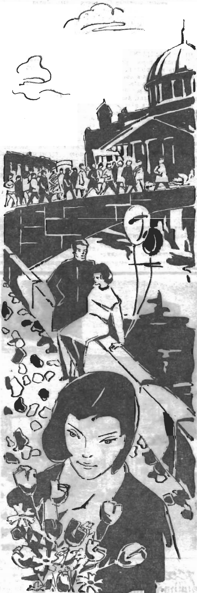
Рисунок Юрия Бурьяна