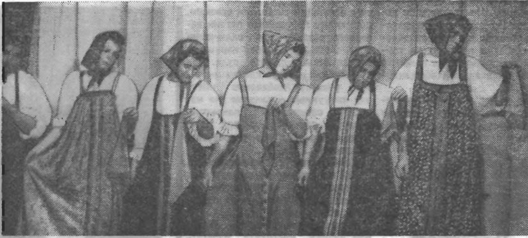
Танец «Березка» в исполнении ансамбля второкурсников «Литмовочки».

Мероприятие — это слово имеет сейчас массу оттенков, вплоть до иронического. И в то же время это понятие емко, как тот огромный труд, который вкладывается в его проведение.