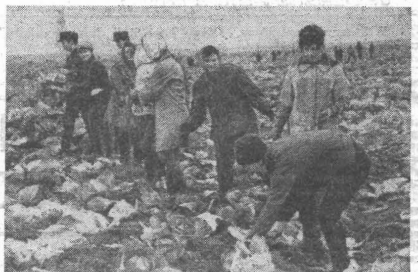
Сентябрьский воскресник. Студенты-литмонавты собирают капусту, помогая одному из пригородных колхозов.