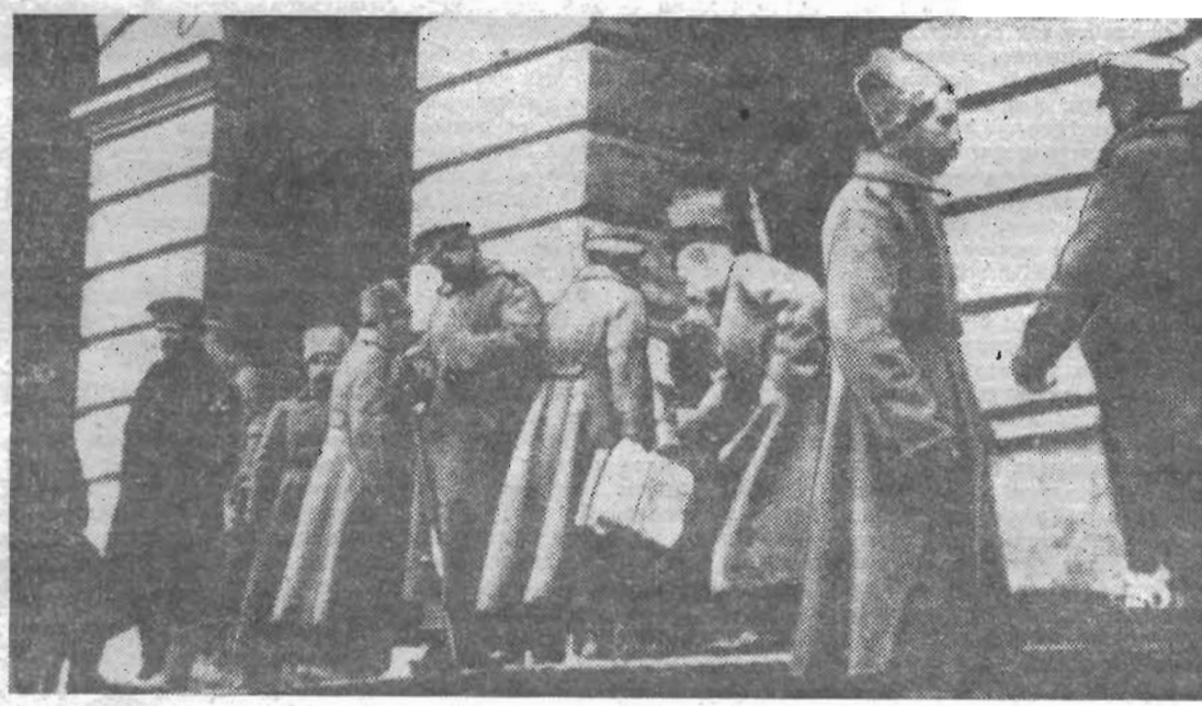
Октябрьские дни. У подъезда Смольного.

(Из Тезисов ЦК КПСС «50 лет Великой Октябрьской социалистической революции»).