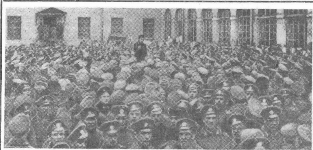
Митинг революционных солдат в октябре 1917 года.