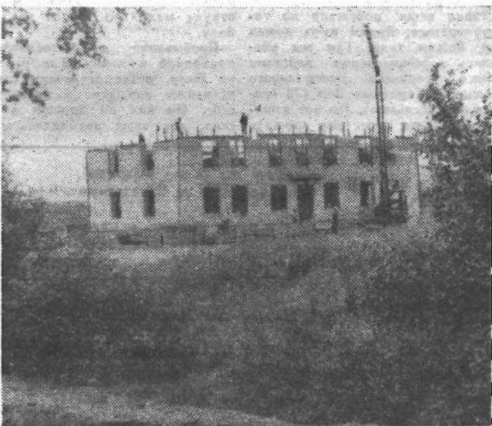
Фото студента 377-й группы Виктора Прохорченко