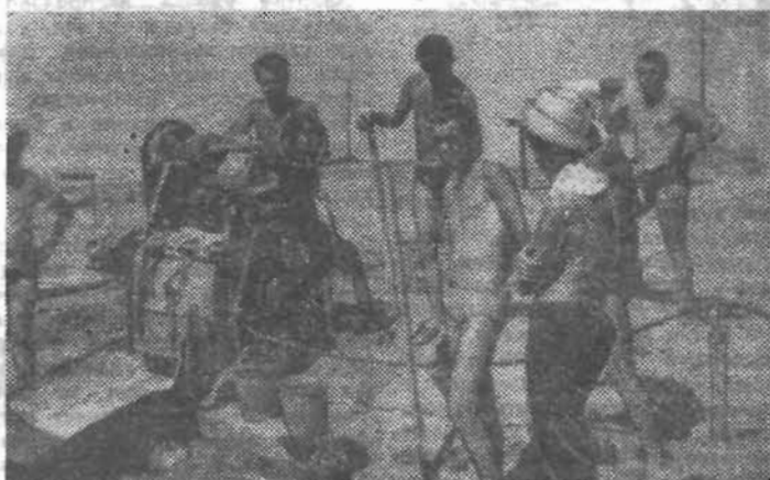
Волховский отряд. Совхоз «Чаплинский» получил от литовцев неплохой подарок — новую контору хозяйства. Все здание от фундамента и до крыши, которая появилась уже после того, как был сделан этот снимок, возведено руками студентов.