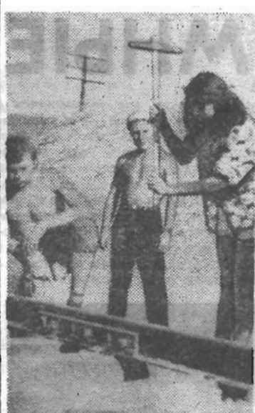
Гурьевский транспортный. Этого момента ждали долго. Последний костыль.