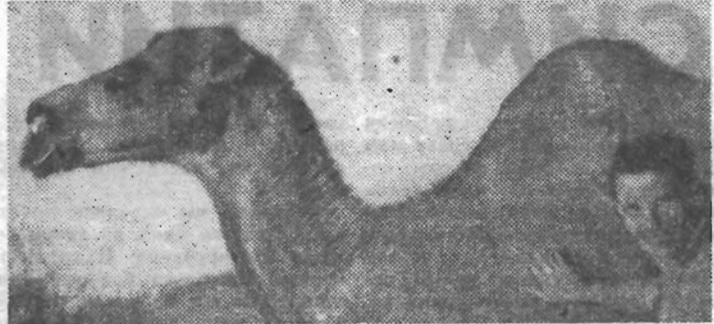
Гурьевский строительный. Верблюды — корабли пустыни — оказались хорошими друзьями человека. Они держали себя с достоинством и в то же время были настроены к гостям весьма благожелательно.