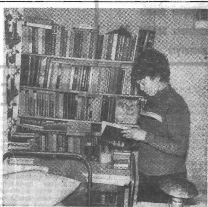
За годы учебы многие студенты собирают неплохие личные библиотеки. Полки с книгами — первое, что бросается в глаза, когдаходишь во многие комнаты нашего общежития.