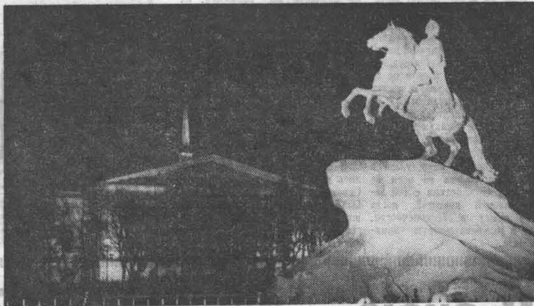
МЕДНЫЙ ВСАДНИК.

Когда пройдет ударная волна, встаньте и наденьте имеющиеся у вас средства защиты. Если их нет, закройте рот и нос любой повязкой, платком или шарфом.