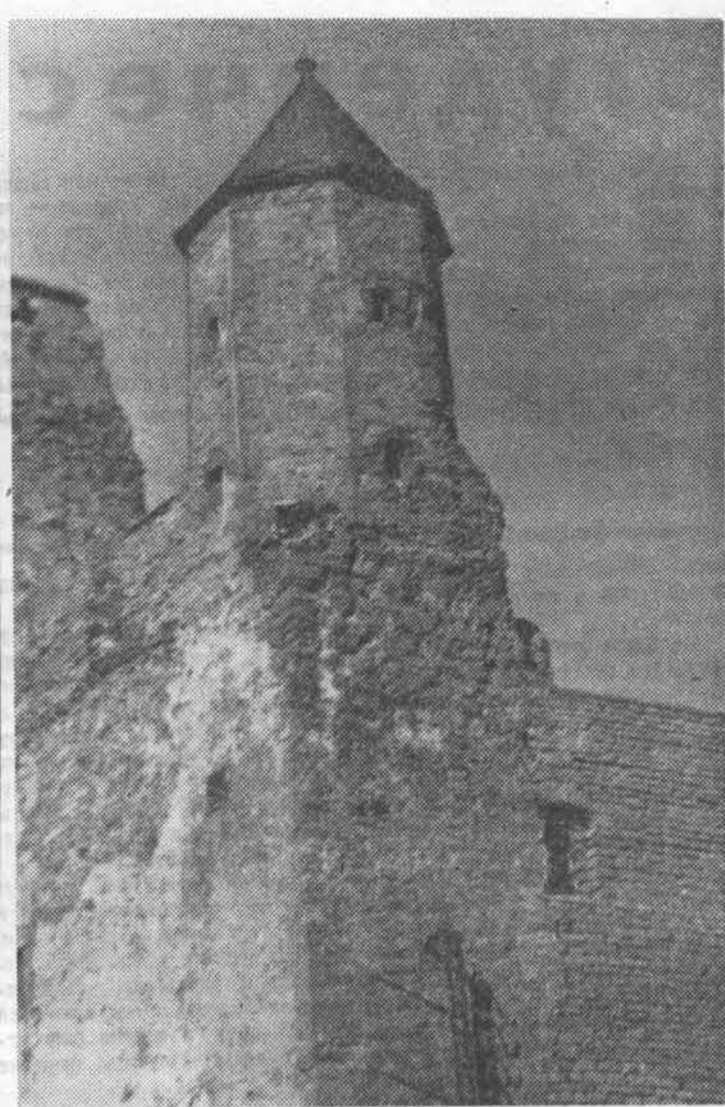
Летние маршруты. Нарва. Башня замка.

Соревнования организует бюро секции хоккея при участии кафедры физического воспитания и спортклуба, а проводит судейская коллегия, возглавляемая главным судьей В. А. Голубенко.