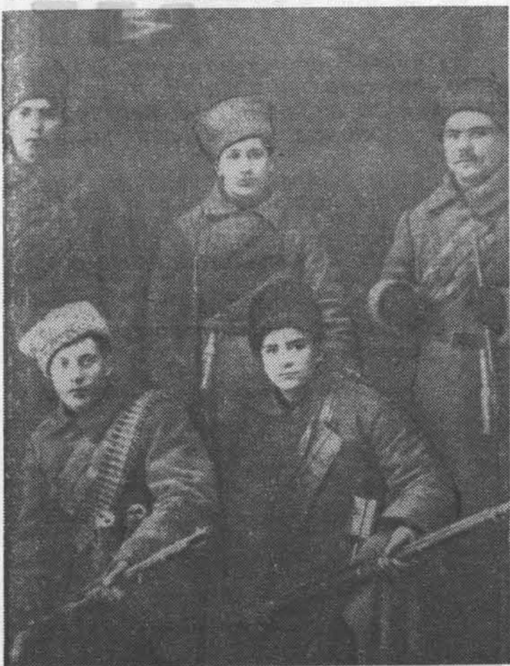
Комсомольцы первого призыва, 1919 год.

регу Амура, у небольшого села Пермское, на нагайское стойбище Дземги.