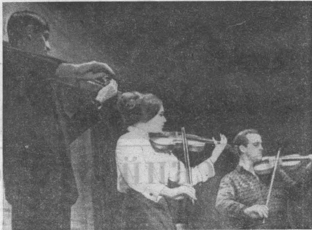
Ансамбль скрипачей на заключительном вечере художественной самодеятельности института.

Студенческий профком предпринимает усилия по организации в институте второго эстрадного оркестра. Первый шаг сделан — приобретена новая ударная установка.