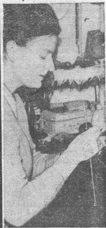
В общежитии. За спицами.