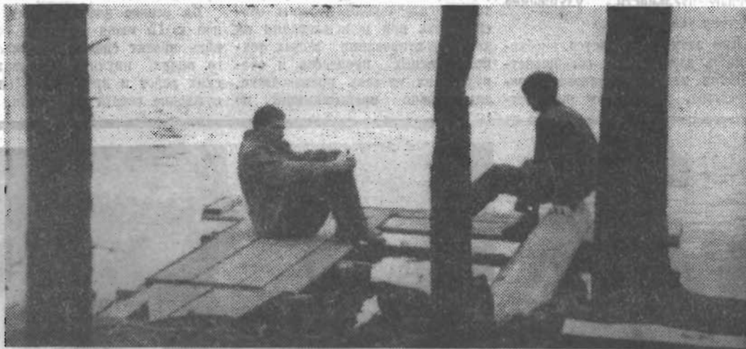
Рабочий день позади.