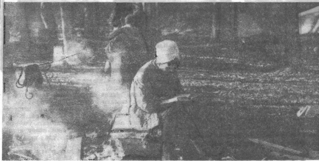
НА ПРИВАЛЕ.