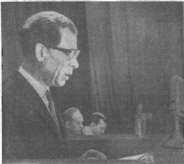
(Продолжение. Начало на стр. 1)

плану, утвержденному парткомом института. В этой работе принимают участие кафедры общественных наук, иностранного языка и некоторые специальные кафедры. Со студентами-иностранцами проводятся совещания по вопросам их учебы, быта и отдыха, экскурсии на предприятия, в музеи, по достопримечательным местам. Студенты-иностранцы участвуют в работе СНО.