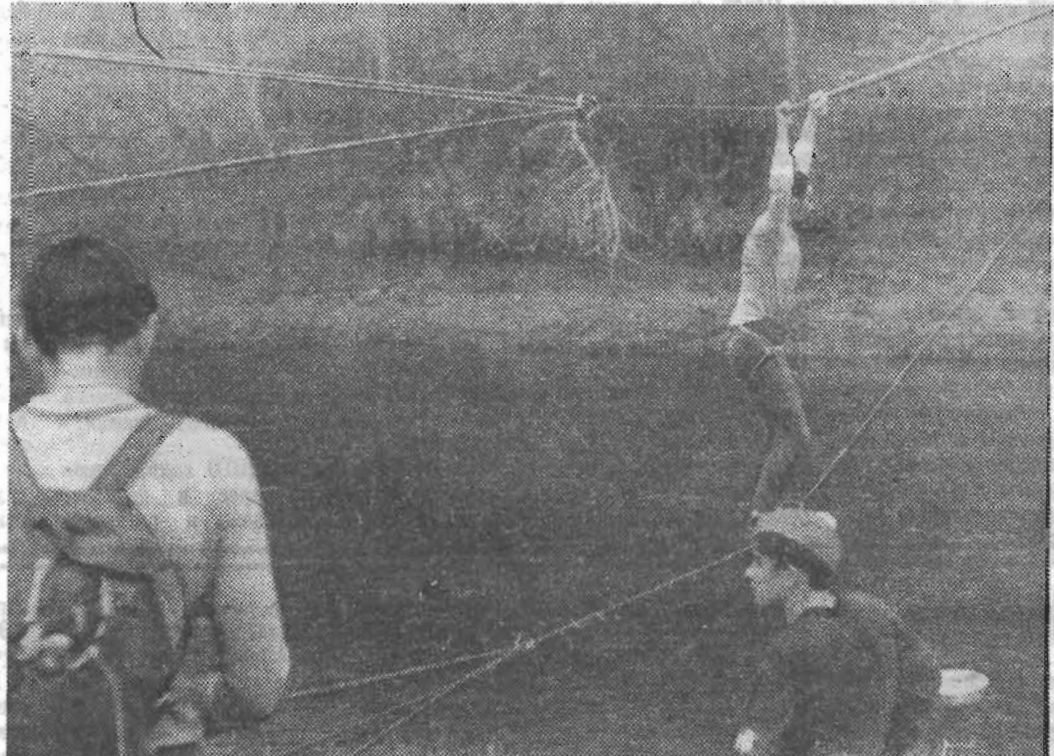
На верхнем снимке: команда ЛИТМО на митинге у мемориальной стелы в честь ополченцев Октябрьского района, отдавших свою жизнь за свободу и независимость Родины в годы Великой Отечественной войны.