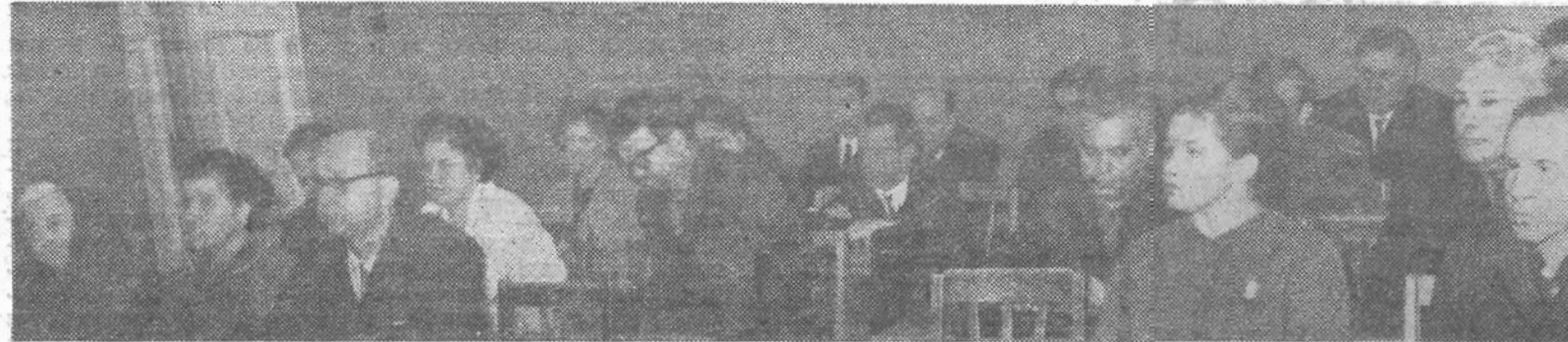
Занятия народных контролеров проводятся в нашем институте впервые. Но, надо полагать, подобного рода семинары станут традицией, что сделает деятельность групп и постов народного контроля более эффективной и конкретной.

ФОРМЫ КОНТРОЛЯ весьма разнообразны. Основной и наиболее распространенной из них является систематическая и квалифицированная проверка непосредственно на месте. Проверка — это надежное средство выяснить, в каком состоянии находится исполнение того или иного решения, задания, поручения. Любая проверка подчинена основному, главному: способствовать выполнению решений и указаний партии, правительства. Боль-