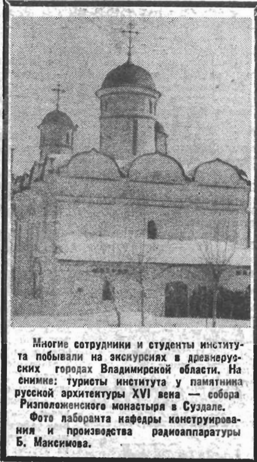
Многие сотрудники и студенты института побывали на экскурсиях в древнерусских городах Владимирской области. На снимке: туристы института у памятника русской архитектуры XVI века — собора Риппозитенского монастыря в Суздале.