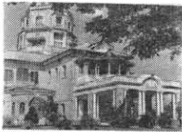
Здание гостиницы в Рангуне.

О волнениях говорить не приходится... Их было немало, тем более, что после соревнований на первенство Европы усталость давала себя чувствовать. Пришлось напрячь все силы, волю и энергию. И вот отборочные соревно-