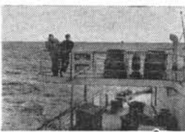
На борту теплохода «Грузия».