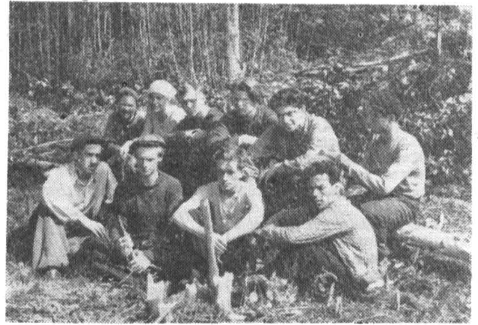
Им, членам 12-й бригады, систематически перевыполняющим нормы выработки, — почетное место в газете. Колхоз «Кировец».