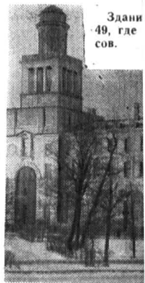
Здание 49, где сов.