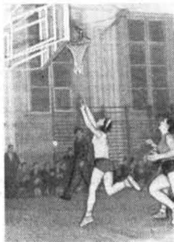
НА СНИМКЕ: момент игры женской команды.

Первого декабря состоялась одна из решающих встреч на первенство вузов по баскетболу. Команды нашего института встретились со спортсменами ЛЭТИ. Отлично провели игры женские команды, менее удачно выступили мужчины. Общий результат встречи — ничья.