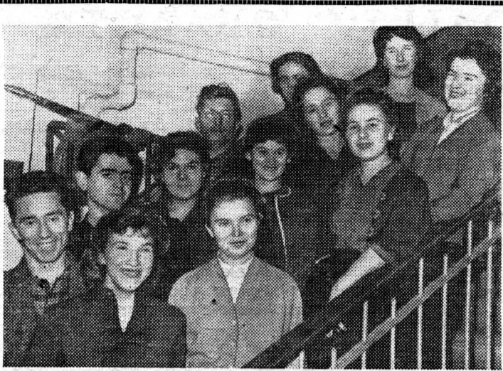
Дружная 520-я группа! Почти все эти студенты успешно сдали экзаменационную сессию. Вот и сейчас они вновь собрались вместе.