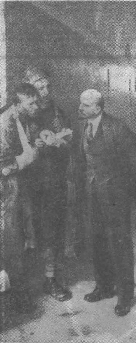
«Вести из деревни».