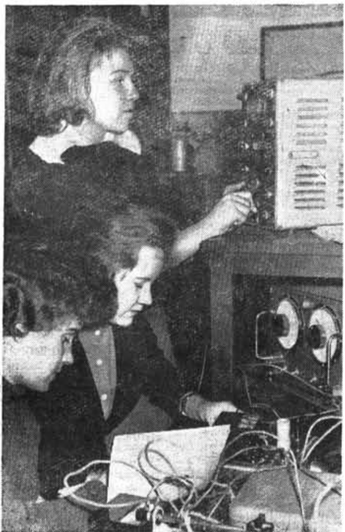
Фото 3. Саниной