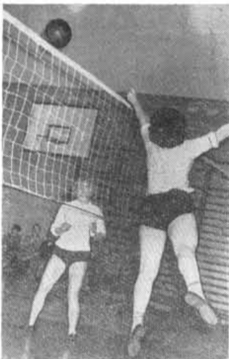
Мяч отбит.

ЕЩЕ один почетный трофей завоевали баскетболисты нашего института. Сильнейшие мужские команды высших учебных заведений города принимали участие в состязаниях на приз имени XXII съезда Коммунистической партии Советского Союза. От нашего института в соревнованиях участвовали две команды, причем вторая выступила на этот раз очень успешно. Она нанесла поражение первым командам Технологического института холодильной промышленности и Механического института. В полуфинале жребий свел оба наших коллектива. Победа досталась первой команде, которая и провела финальную встречу с исключительно сильным соперником — спортивным клубом Института физической культуры имени Лесгафта. Наши баскетболисты играли очень дружно и заслуженно завоевали почетный приз.