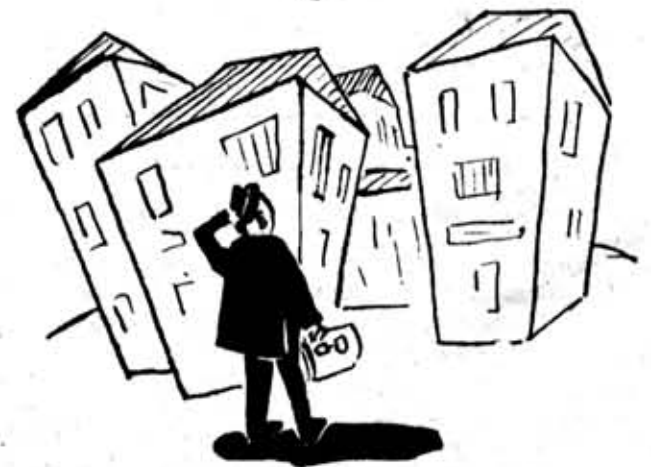
НА РАСПУТЬЕ... Преподаватель: — И которое все же из них общежитие?

Посещения преподавателями общежития должны стать целевыми. У нас есть много преподавателей, которые найдут чем поделиться с молодежью.