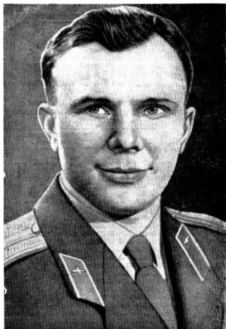
Юрий Алексеевич ГАГАРИН.

Всем ученым, инженерам, техникам, рабочим, всем коллективам и организациям, участвовавшим в успешном осуществлении первого в мире космического полета человека на корабле-спутнике «Восток», первому советскому космонавту товарищу Гагарину Юрию Алексеевичу