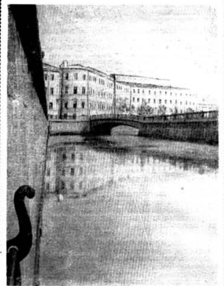
Канал Грибоедова.