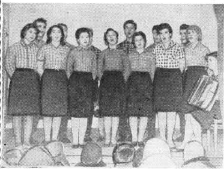
Так мы начинали концерт.