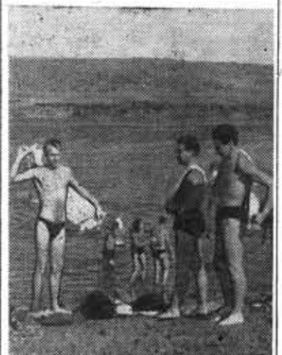
Как приятно искупаться после напряженного трудового дня в полноводном Ишиме.

идеологий. Коммунистическая идеология и только она, впитав в себя все лучшее, что было создано передовой общественной мыслью человечества, научно выражает потребности современного общественного развития. В ней воплощено будущее человечества. Общечеловеческие духовные ценности формируются и будут формироваться на основе коммунистической идеологии.