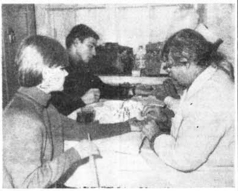
Широкий отклик у студентов и сотрудников института нашел призыв институтской ячейки РОКК о безвозмездной сдаче крови. На временный донорский пункт явилось желающих даже больше, чем были в состоянии принять медицинские работники.