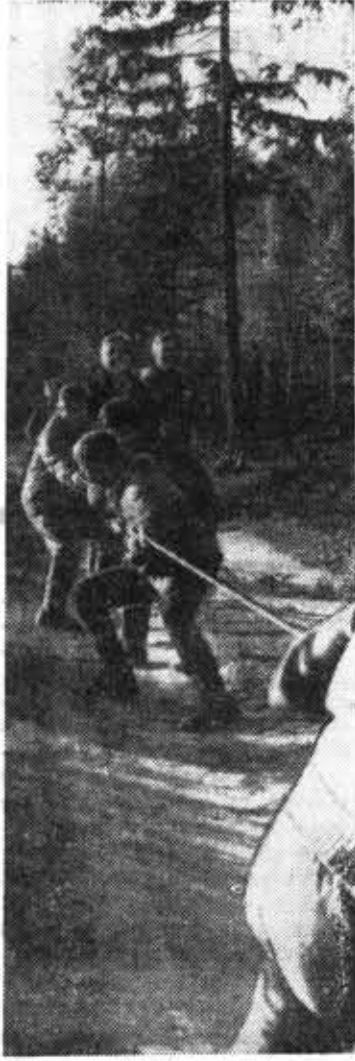
На слете туристов ЛИТМО. Традиционное состязание — перетягивание каната.