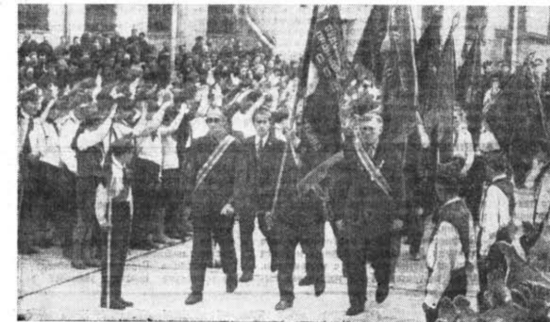
Традиционная пионерская линейка на Адмиралтейском заводе. Гости из подшефных школ у монумента Славы.

Воспитать настоящих людей будущего можно лишь в том случае, если они с первых шагов своей сознательной деятельности становятся не просто созерцателями труда взрослых, но и его