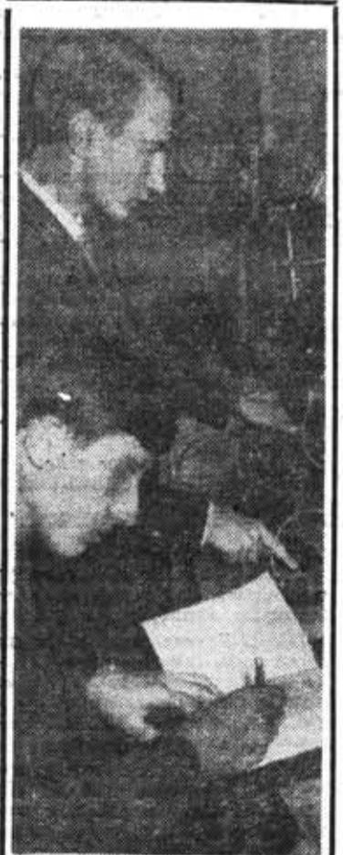
Свыше 20 тысяч комсомольцев состоит в вузовских организациях Октябрьского района. Студенты овладевают новейшими достижениями науки и техники, активно участвуют в исследовательской работе. На снимке: лабораторная работа в Институте точной механики и оптики.

В районе создан организационный комитет по проведению смотра. Для награждения лучших первичных организаций — победителей смотра учреждены пять памятных вымпелов.