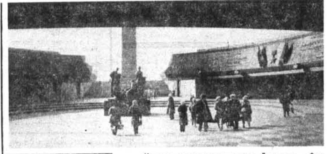
Мемориал героических защитников Ленинграда.