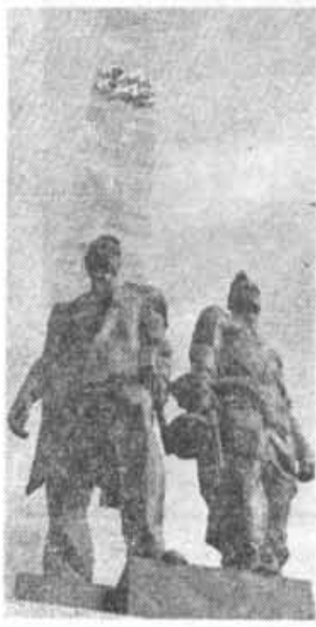
Подвиг защитников Ленинграда увековечен в бронзе скульптором М. К. Аникушиным.