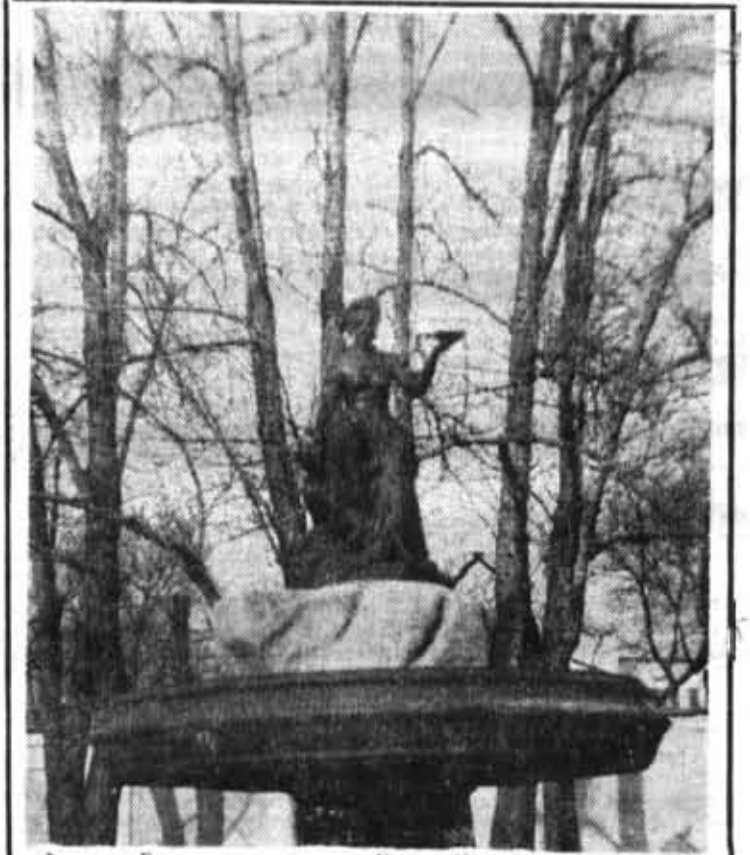
Фонтан «Гигиен» на проспекте Карла Маркса.

минут надо делать короткие «разминки» — походить по комнате, сделать несколько физических упражнений возле открытой форточки, несколько раз глубоко вздохнуть. Не следует заниматься одним и тем же делом больше трех часов. Перемена занятий снимает усталость, освежает го-