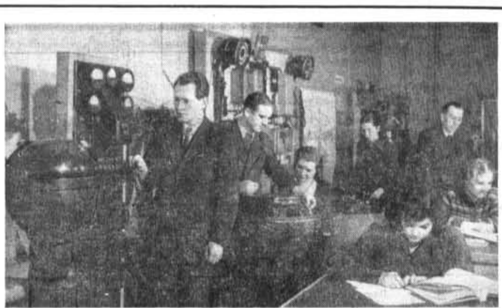
Из фотолетописи института. 50-е годы. На кафедре гироскопических и навигационных приборов.

По данным Всесоюзного треста оптико-механической промышленности (ВТОМП) на предприятиях оптической промышленности и в Государственном оптическом институте (ГОИ) в октябре 1930 года имелось 168 инжене-