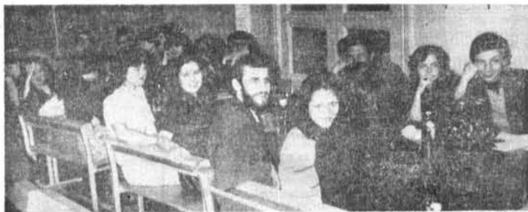
На дружеской встрече в студенческом клубе «Спектр».

Вскоре после опубликования первой работы Фридмана появилась заметка Эйнштейна. Эйнштейн писал, что он нашел ошибку в вы-