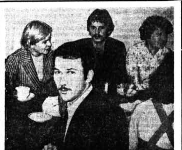
Заседание студенческого клуба «Спектр».

Потом каждый рассказывает соседям, как живет молодежь его