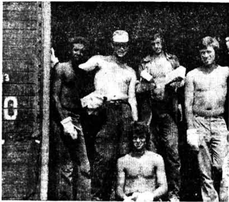
Из года в год выезжает на стройки Ставропольского края интернациональный ССО «Товарищ». На снимке: бойцы отряда на разгрузке строительных материалов на станции Минеральные Воды.