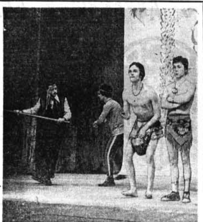
Веселая студенческая интермедия на конкурсном вечере инженерно-физического факультета.

Станислава Рассадина — «Похвала здравому смыслу, или пятнадцать лет спустя». Ничего особенного, просто пятнадцать лет назад впервые в «Юности» были напечатаны два рассказа ныне известного прозаика Фазиля Искандера, а тогда — лишь начинающего поэта. Рассадина тонко прослеживает путь популярного писателя.