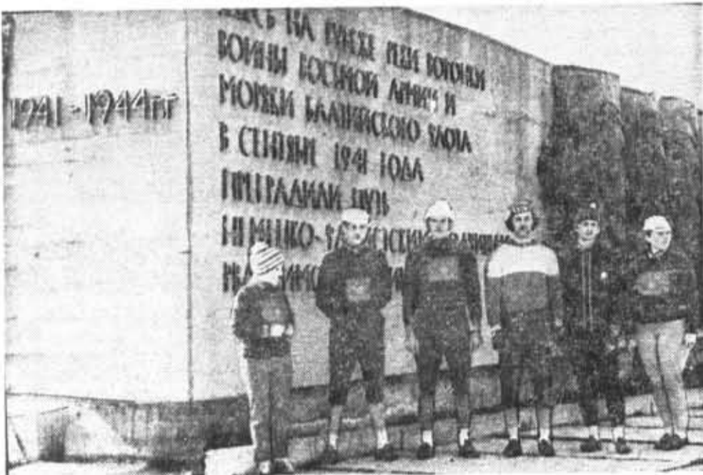
Студенты нашего института чтут память героев-воинов, сражавшихся на подступах к Ленинграду. Ежегодно в рамках военно-патриотических слетов и агитпоходов комсомольцы института посещают мемориалы, сооруженные на местах боевых сражений.

Партийный комитет предложил партийной группе и руководству кафедры автоматки и телемеханики устранить указанные недостатки, о выполнении постановления информировать партком в мае 1986 года.