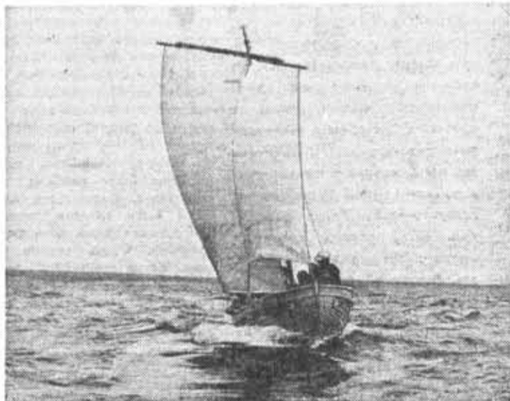
Озеро Берестовое — традиционное место тренировок яхтсменов и гребцов нашего института.