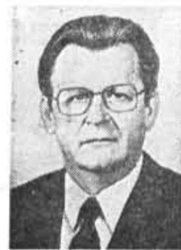
В. И. ВОРОТНИКОВ, член Политбюро ЦК КПСС