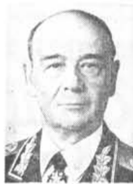
С. Л. СОКОЛОВ, кандидат в члены По- литбюро ЦК КПСС