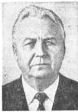
Е. К. ЛИГАЧЕВ, член Политбюро ЦК КПСС, секретарь ЦК КПСС