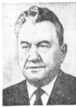
Д. А. КУНАЕВ, член Политбюро ЦК КПСС