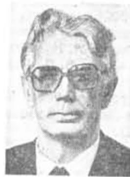
В. А. МЕДВЕДЕВ, секретарь ЦК КПСС