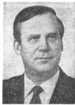
Н. И. РЫЖКОВ, член Политбюро ЦК КПСС