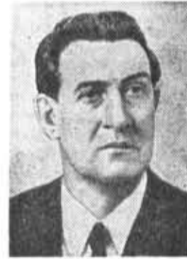
В. И. ДОЛГИХ, кандидат в члены По- литбюро ЦК КПСС, сек- ретарь ЦК КПСС