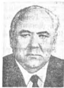
В. П. НИКОНОВ, секретарь ЦК КПСС