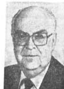
А. Ф. ДОБРЫНИН, секретарь ЦК КПСС