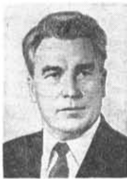
П. Н. ДЕМИЧЕВ, кандидат в члены По- литбюро ЦК КПСС