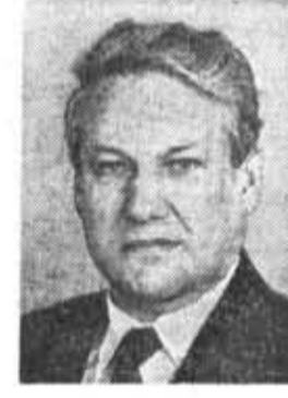
Б. Н. ЕЛЬЦИН, кандидат в члены По- литбюро ЦК КПСС