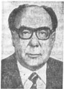
А. Н. ЯКОВЛЕВ, секретарь ЦК КПСС