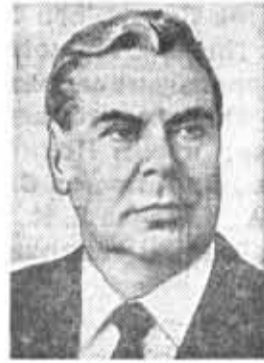
И. В. КАПИТОНОВ, Председатель Цент- ральной ревизионной комиссии КПСС