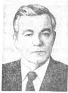
М. В. ЗИМЯНИН, секретарь ЦК КПСС