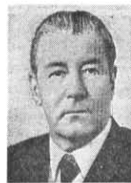
М. С. СОЛОМЕНЦЕВ, член Политбюро ЦК КПСС, Председатель КПК при ЦК КПСС