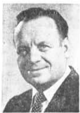
Л. Н. ЗАЙКОВ, член Политбюро ЦК КПСС, секретарь ЦК КПСС