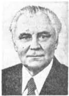
В. В. ЩЕРБИЦКИЙ, член Политбюро ЦК КПСС