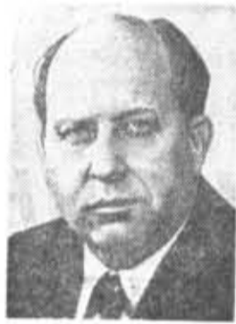
Н. В. ТАЛЫЗИН, кандидат в члены По- литбюро ЦК КПСС