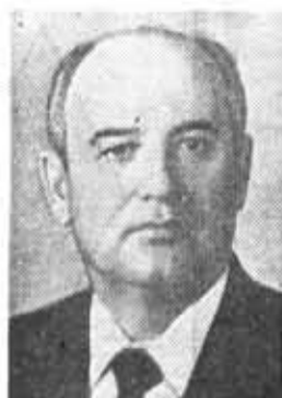
М. С. ГОРБАЧЕВ, член Политбюро ЦК КПСС, Генеральный сек- ретарь ЦК КПСС