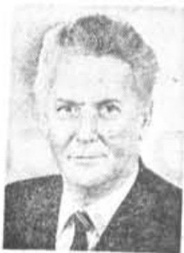
Ю. Ф. СОЛОВЬЕВ, кандидат в члены По- литбюро ЦК КПСС