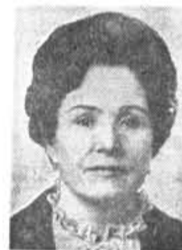
А. П. БИРЮКОВА, секретарь ЦК КПСС