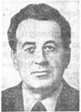
Г. П. РАЗУМОВСКИЙ, секретарь ЦК КПСС