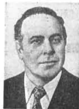
Г. А. АЛИЕВ, член Политбюро ЦК КПСС