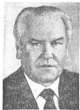
Н. Н. СЛЮНЬКОВ, кандидат в члены По- литбюро ЦК КПСС