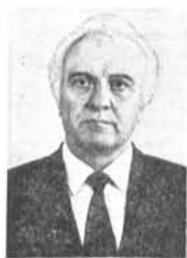
Э. А. ШЕВАРДНАДЗЕ, член Политбюро ЦК КПСС