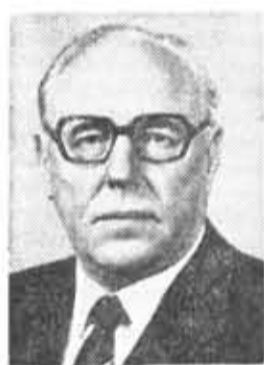
В. М. ЧЕБРИКОВ, член Политбюро ЦК КПСС