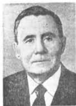
А. А. ГРОМЫКО, член Политбюро ЦК КПСС